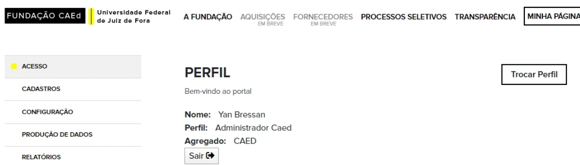
Figura 2 – Tela inicial de usuário do SisPro, categoria Acesso