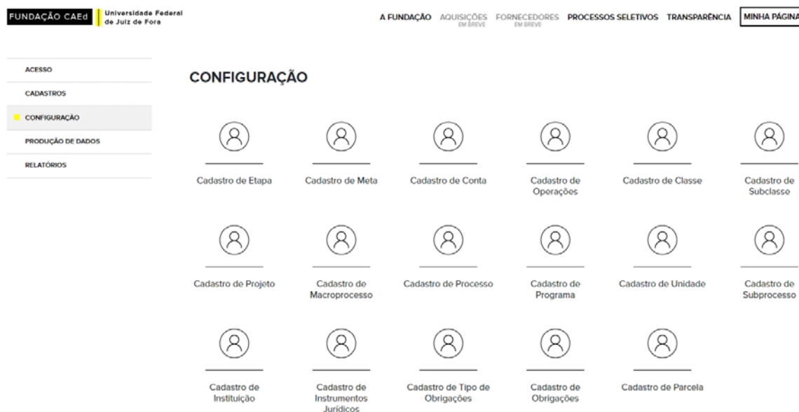
Figura 4 – Tela da categoria Configuração