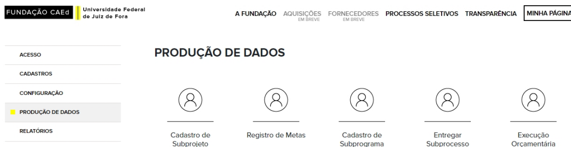
Figura 5 – Tela da categoria Produção de dados