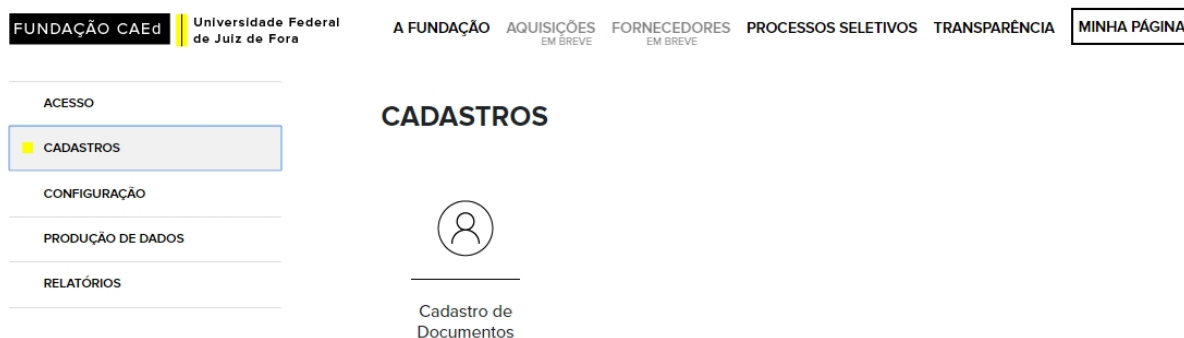
Figura 3 – Tela da categoria Cadastros