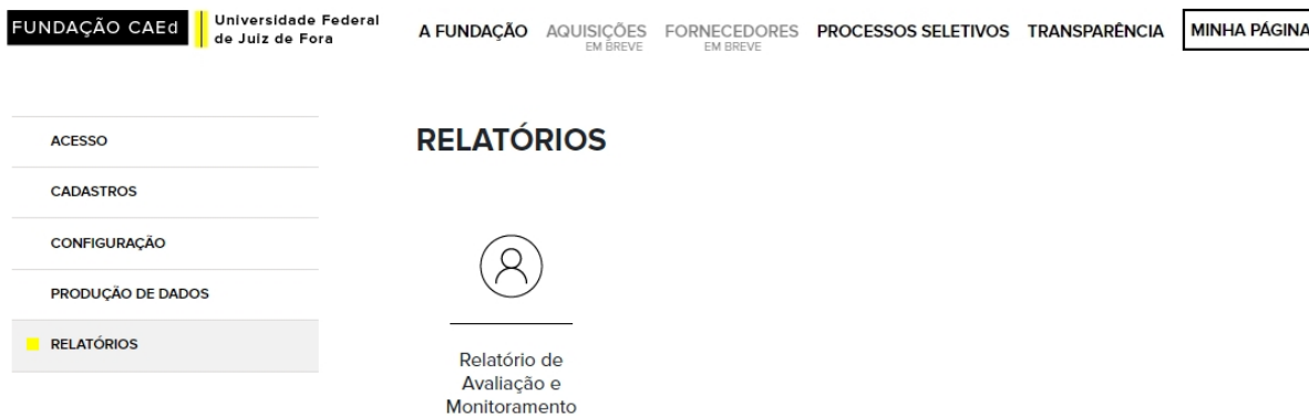
Figura 6 – Tela da categoria Relatórios

Fonte: SisPro, http://fundacaocaed.org.br/#!/minhapagina/ (2021).